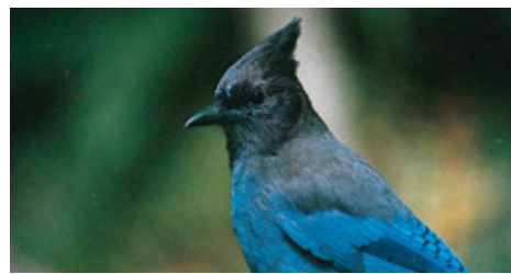
Arrendajo de Steller

Un Tesoro Ecológico El Monumento Nacional del Bosque Muir y la cuenca del Arroyo Secoya forman una parte de la Reserva Bioesférica Internacional del Portón Dorado—una de las reservas de flora y fauna más ricas y más amenazadas de extinción en todo el planeta. Situado cerca de San Francisco, el Bosque Muir recibe cada año casi un millón de visitantes desde todo el mundo. Es verdaderamente una ventana abierta al mundo complejo de la naturaleza y la conservación.