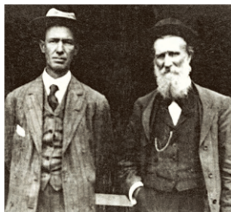
William Kent y John Muir

Este es el mejor monumento para los aficionados de los árboles que pudiera encontrarse en todos los bosques del mundo. Me ha hecho un gran honor, y estoy orgulloso de ello. —John Muir a William Kent